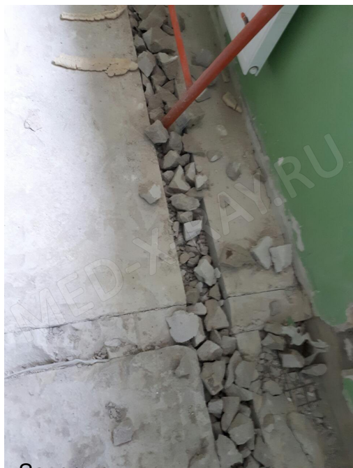
Завершен монтаж усиления дверного проема для установки рентгенозащитной двери.