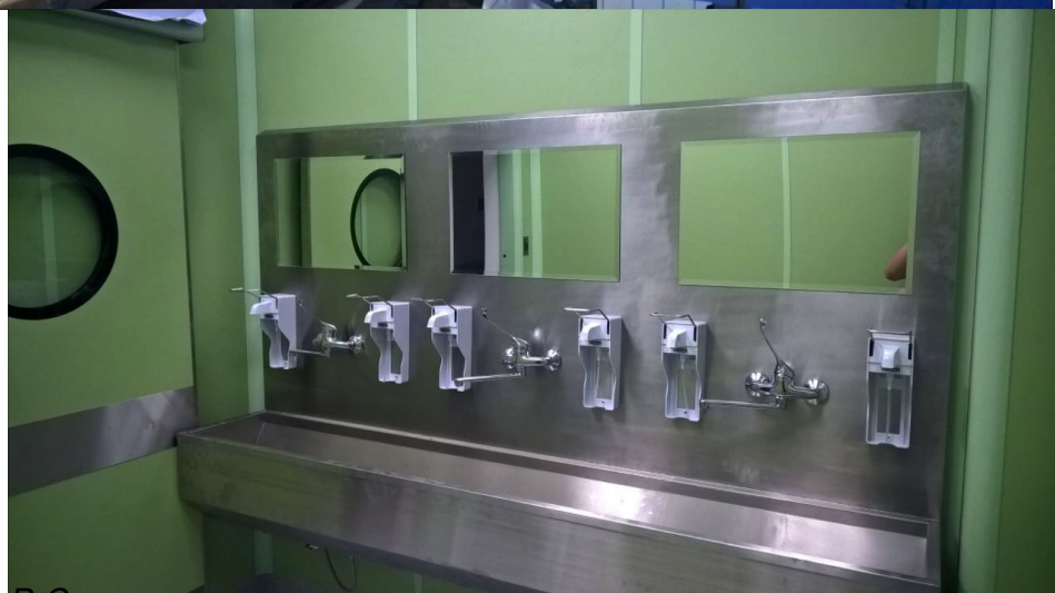
В Самаре прошло торжественное открытие перинатального центра