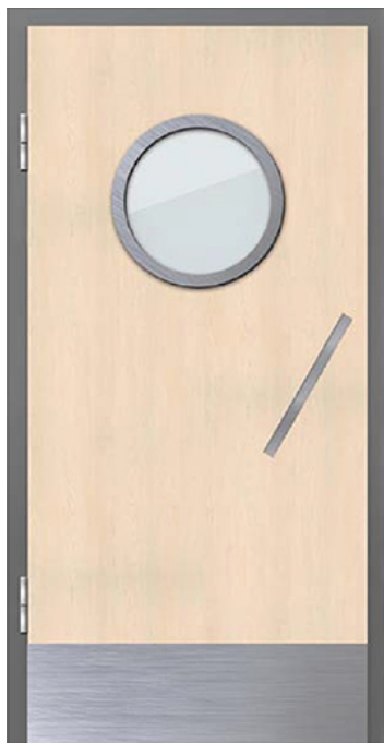
Двери для входов в буфетные MED-19